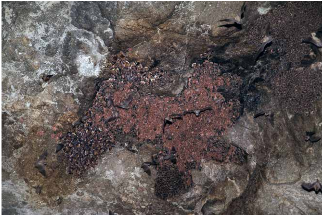
Fig. 12 – Parte della colonia riproduttiva di M. schreibersii , M. myotis e M. blythii all'interno delle gallerie della cava di Monte Tondo.

Alle specie citate, Rhinolophus ferrumequinum , Myotis myotis , Myotis blythii e Miniopterus schreibersii , vanno poi ad aggiungersi anche il rinolofa minore ( Rhinolophus hipposideros ), presente nelle gallerie di cava durante tutto l'anno, in particolar modo nel periodo invernale con circa un centinaio di esemplari, e