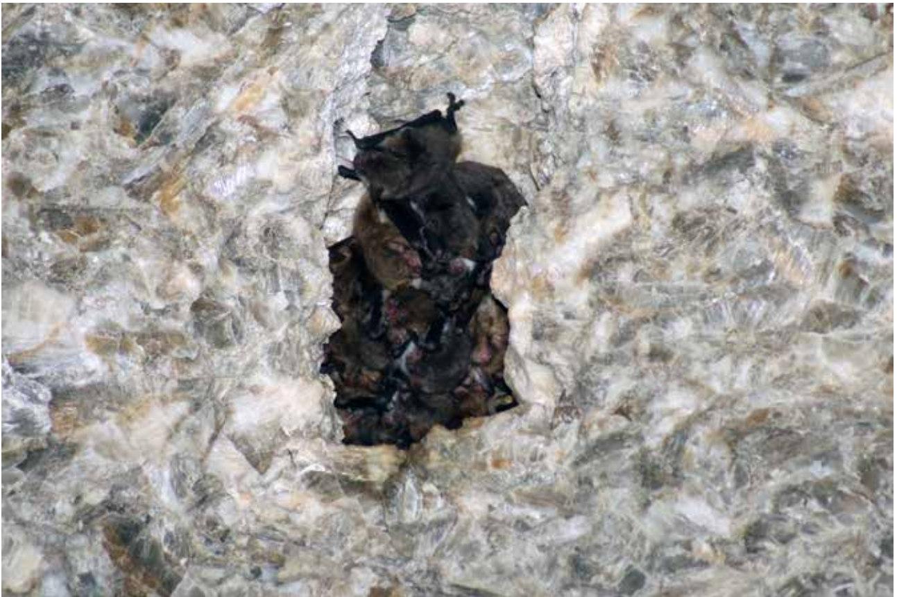
Fig. 19 – Colonia riproduttiva di vespertilio criptico ( Myotis crypticus ) all'interno delle gallerie dell'ex cava SPES.

spertilio criptico ( Myotis crypticus ). Nell'estate 2015, un piccolo gruppo di circa una ventina di esemplari di “piccoli” Myotis è stato osservato all'interno di una cavità localizzata nella volta di una galleria. Vista la somiglianza fra varie specie del Genere Myotis , l'osservazione, svolta a distanza e con l'ausilio di binocolo, ha permesso solo di ipotizzare che si trattasse di esemplari di M. crypticus (definito al tempo M. nattereri ) (PERON et alii 2015, pag. 151). L'osservazione si è ripetuta anche nell'estate 2016 e in estati successive, compresa l'ultima estate monitorata, quella 2023. In tutti i casi sono stati osservati circa 30-40 esemplari, aggregati in uno o due gruppetti (fig. 19). La conferma che si trattasse di M. crypticus , e in particolare di una colonia riproduttiva di questa specie, è arrivata però solo grazie al ritrovamento, a terra, in corrispondenza del punto delle gallerie utilizzato dal gruppo di “piccoli” Myotis , di alcuni esemplari morti (giovani e cuccioli) di M. crypticus , a partire dall'estate 2017 (BERTOZZI 2022, pag. 372).