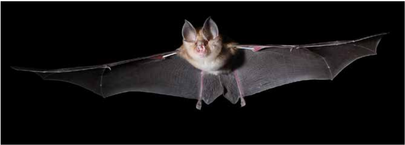
Fig. 2 – R. euryale in volo

La presenza dei miniotteri nella grotta di Onferno non è però costante durante tutto l'anno: se durante il periodo estivo si possono contare migliaia di esemplari, durante l'inverno le presenze della specie si annullano quasi totalmente (BERTOZZI, SCARAVELLI 2003). Entro il mese di agosto, quando i giovani nati due mesi prima sono in grado di volare e uscire ogni sera a cacciare insetti, la grande colonia riproduttiva si disgrega e gli esemplari si distribuiscono, generalmente a gruppi (trattandosi di una specie prettamente gregaria), in diverse zone della grotta. Nei mesi autunnali le presenze osservabili sono numericamente molto minori rispetto al periodo estivo, anche se il calo non sempre appare graduale con l'approssimarsi della stagione sfavorevole. Nel mese di novembre o dicembre, poi, in corrispondenza di un deciso calo della temperatura esterna, che comporta anche un netto cambiamento della circolazione dell'aria internamente alla grotta, in pochi giorni si nota un abbandono quasi totale dell'ipogeo. Durante il periodo invernale i miniotteri, quindi, lasciano la grotta di Onferno per passare l'inverno in altri siti ipogei, in particolare presso un ex tunnel ferroviario, galleria Piagge, nella vicina Repubblica di San Marino (SCARAVELLI et alii 2015), a circa 11 km di distanza in linea d'aria dalla grotta di Onferno.