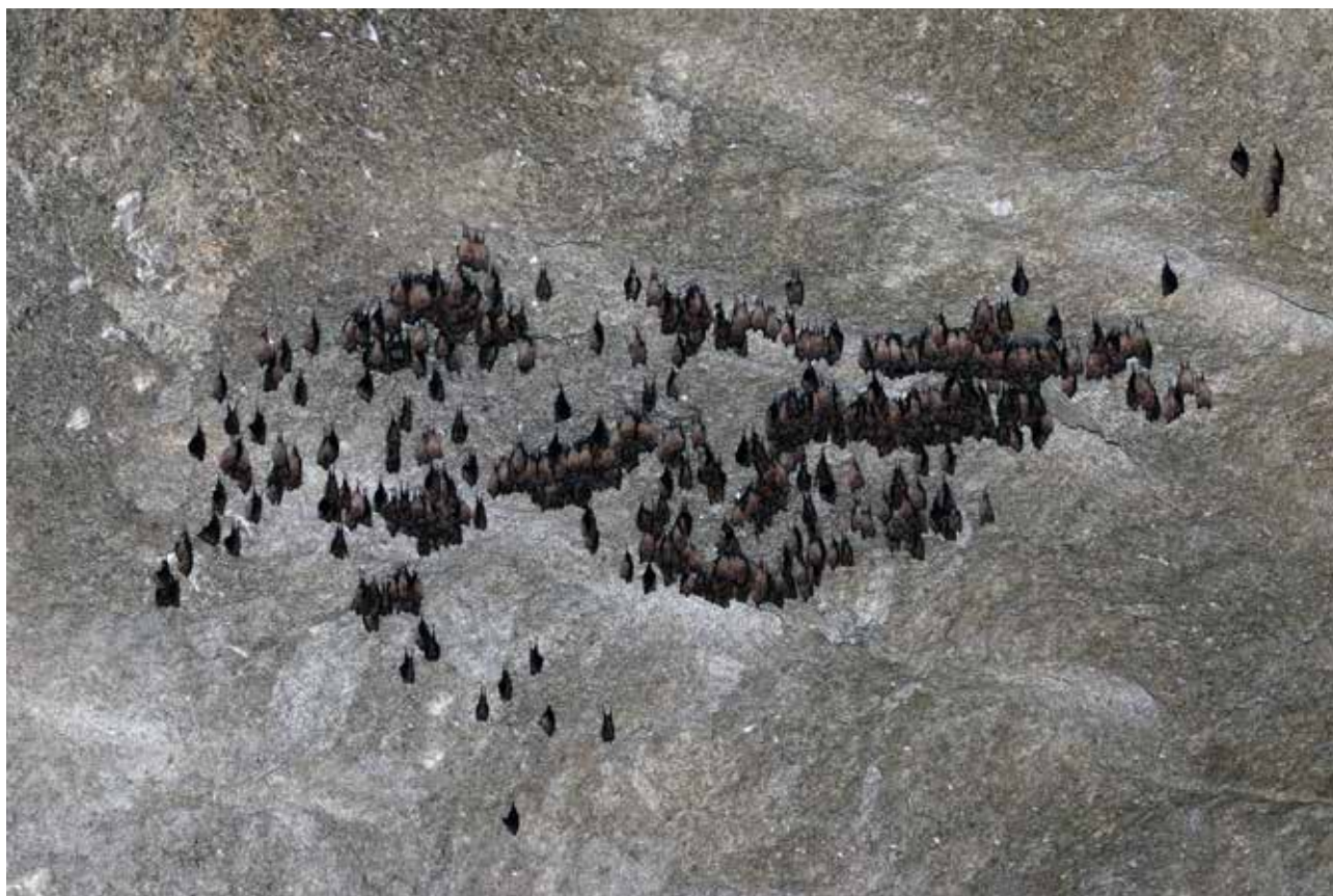
Fig. 18 – Colonia svernante di 673 Rhinolophus ferrumequinum all'interno delle gallerie dell'ex cava SPES (foto M. Bertozzi).

Un'altra presenza estiva particolarmente interessante, all'interno delle gallerie dell'ex cava, è quella del ve-