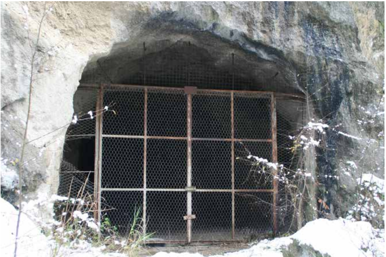
Fig. 15 – Vecchia cancellata di chiusura delle gallerie dell'ex cava SPES.