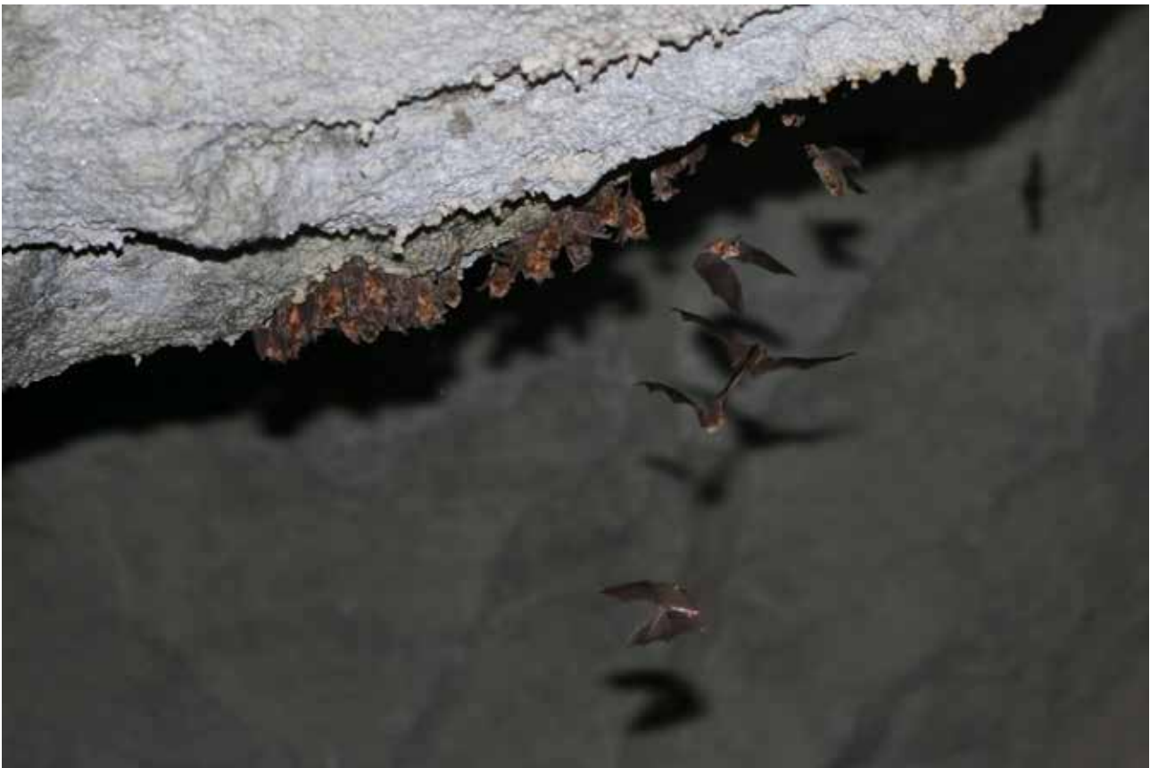
Fig. 11 – Parte della colonia riproduttiva di rinolofo Euriale ( Rhinolophus euryale ) all'interno delle gallerie della cava di Monte Tondo.

Il primo dato da segnalare è la presenza di colonia riproduttiva di rinolofo Euriale ( Rhinolophus euryale ). La nursery , osservata per la prima volta nell'estate del 2015 (BERTOZZI 2016B) è attualmente composta da circa 400 esemplari (fig.11). Si tratta dell'unica colonia riproduttiva di rinolofo Euriale al momento nota per il Parco della Vena del Gesso romagnola, e potrebbe essersi formata da esemplari provenienti da altre due nursery attualmente non più presenti: una, con circa 100 individui, nota fino all'estate 2012 nella vicina Grotta del Re Tiberio (BERTOZZI 2013, p.353) e un'altra, con almeno 300 esemplari, presente nella Grotta