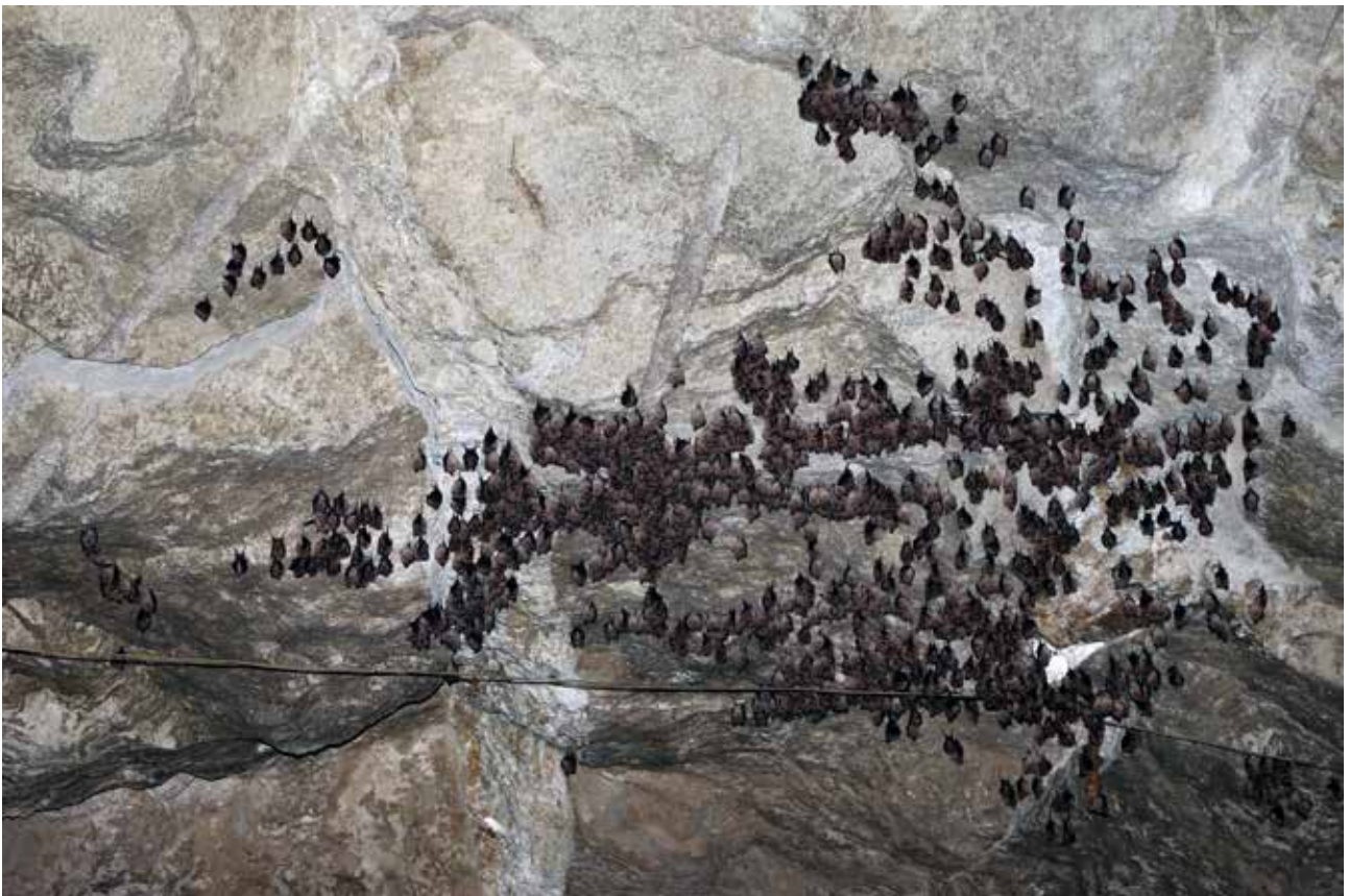
Fig. 14 – Colonia svernante di oltre 1300 Rhinolophus ferrumequinum all'interno delle gallerie della cava di Monte Tondo.