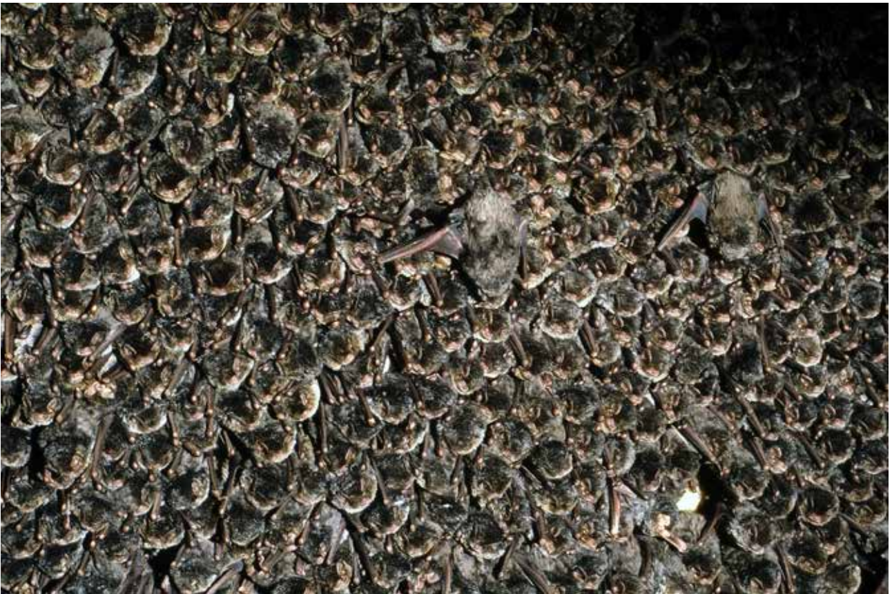
Fig. 8 – Parte della grande colonia svernante di miniottero ( Miniapterus schreibersii ) nella Tanaccia di Brisighella, anno 1987.