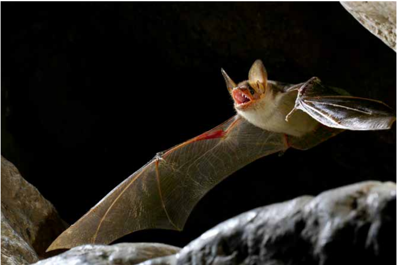
Fig. 6 – Esemplare di grande Myotis ( Myotis myotis / Myotis blythii ).

ma caratterizzata da un'ampia sala adiacente all'ingresso. Il momento di maggior presenza di pipistrelli all'interno di questa grotta è l'inverno, periodo in cui diventa uno dei più importanti roost di svernamento di Rhinolophus ferrumequinum del Parco della Vena del Gesso romagnola (BERTOZZI 2015). La presenza di una consistente colonia invernale della specie è nota già dal 1957, per osservazione da parte dei rilevatori della grotta, e testimoniata anche da una vecchia foto dei primi anni '70 dell'archivio fotografico del Gruppo Speleologico Faentino, che ritrae alcune centinaia di esemplari della colonia (BASSI 2009). Oltre al rinolofo maggiore, per la grotta sono segnalati dagli anni '80 anche rinolofo minore ( R. hipposideros ) e rinolofo Euriale ( R. euryale ), quest'ultimo in una colonia mista con rinolofo maggiore, sempre in periodo invernale (BASSI 2009). Di queste tre specie, dai dati raccolti con regolarità negli ultimi quattordici anni, è stato possibile confermare le presenze svernanti solo di Rhinolophus ferrumequinum e di Rhinolophus hipposideros . Per la prima specie è stata riconfermata la presenza di una significativa colonia (fig. 7) composta da un minimo di circa 100 esemplari (inverno 2010-2011) ad un massimo di 295 esemplari (inverno 2022-2023). Minore è invece il numero di esemplari di rinolofo minore in letargo, presenti in tutti gli inver-