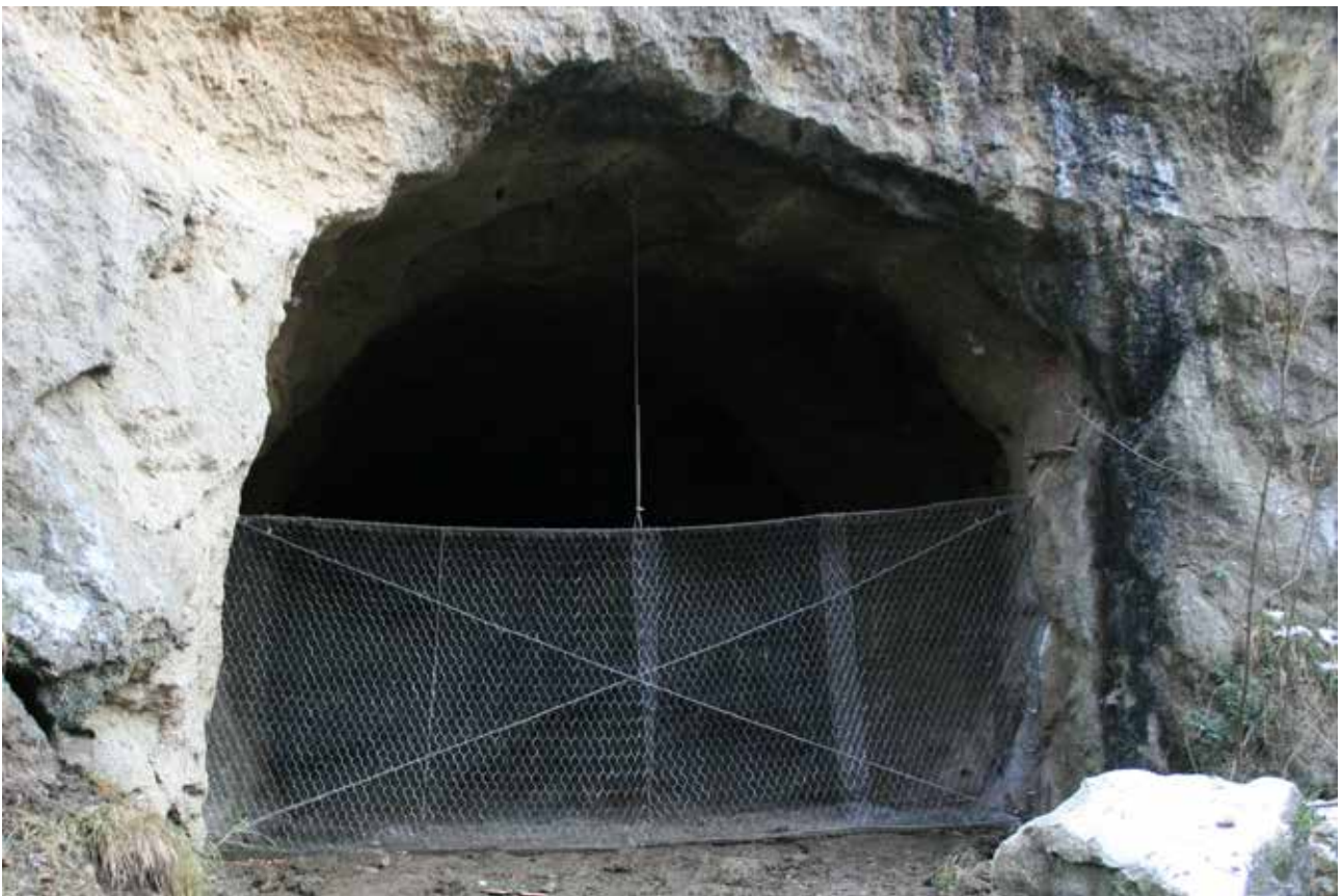
Fig. 16 – Nuova struttura di chiusura delle gallerie dell'ex cava SPES, realizzata con il Progetto Life "Gypsum".