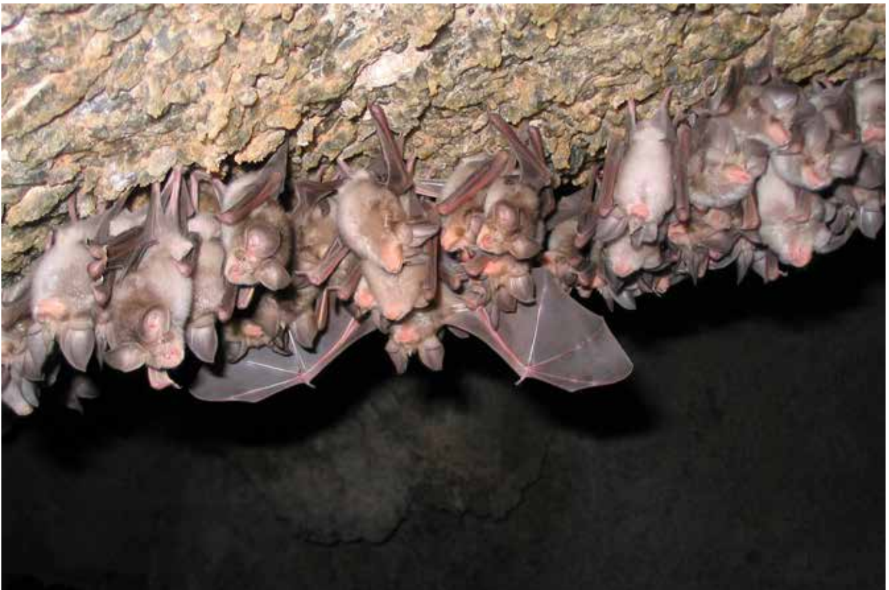
Fig. 3 – Giovani esemplari di R. euryale della colonia riproduttiva della grotta di Onferno.

Il miniottero sembra frequentare la grotta soprattutto nei periodi autunnale e primaverile. I monitoraggi effettuati nell'autunno del 2003 hanno fatto registrare un numero di esemplari della specie compreso tra 200 e 500. L'attività di ricerca svolta, ha potuto inoltre di-