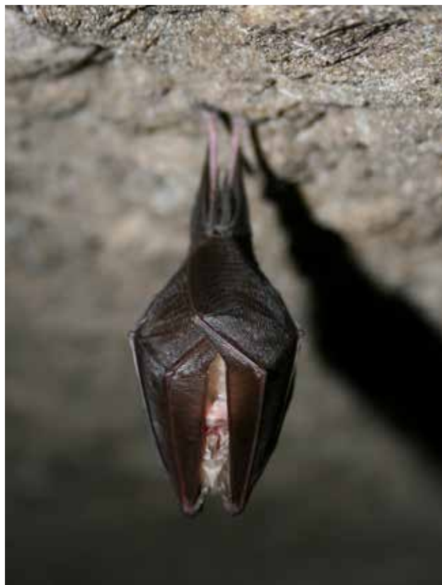
Fig. 5 – Esemplare di rinolofo minore ( Rhinolophus hipposideros ).