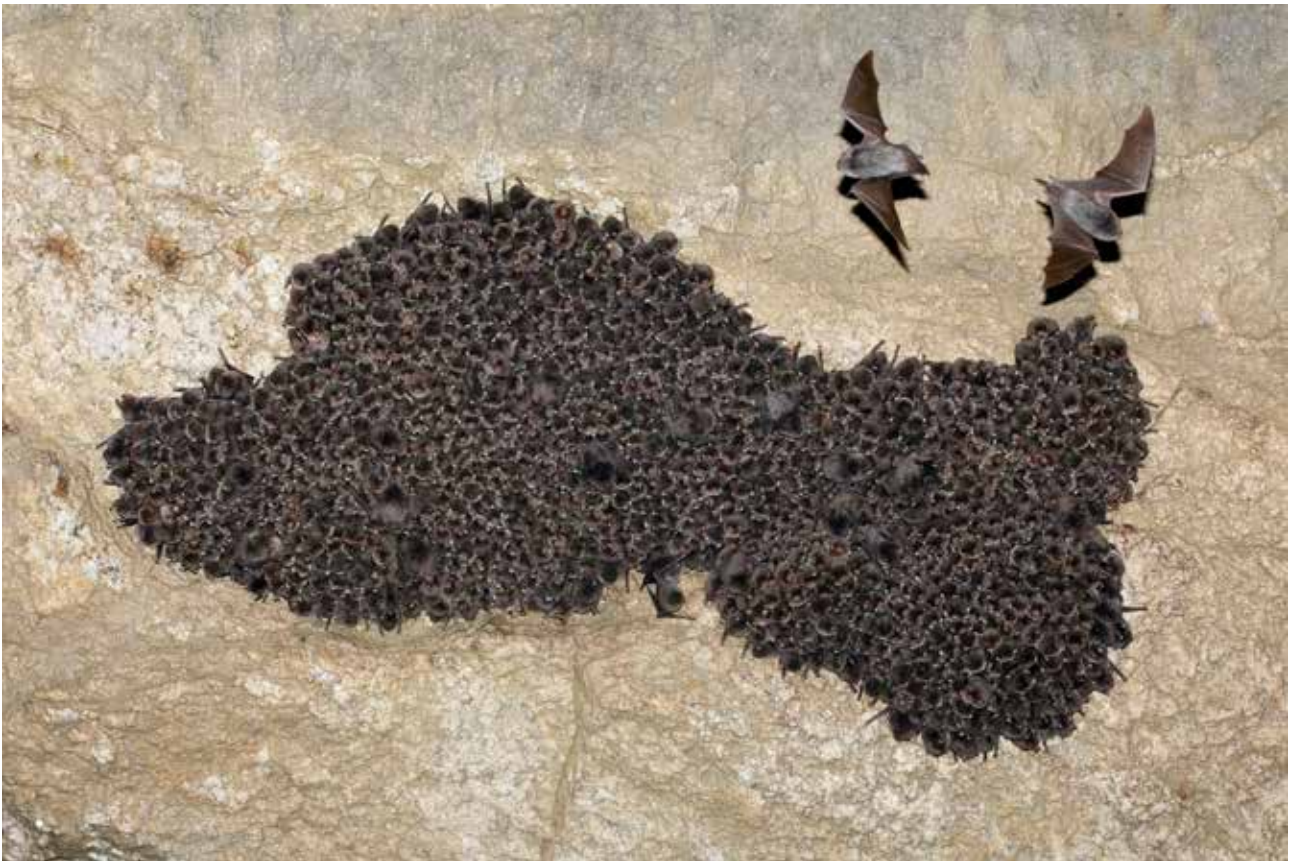
Fig. 4 – Gruppo di M. schreibersii nella grotta del rio Strazzano.

mostrare che molti di quegli esemplari provenivano dalla grotta di Onferno e sarebbero poi andati a svernare nell'ex tunnel ferroviario, galleria Piagge, nella vicina Repubblica di San Marino (vedi infra , Grotta di Onferno ). Un numero ancora maggiore di esemplari, stimato in circa 1200 individui, è stato rilevato da Francesco Grazioli, durante il rilievo speleologico della grotta effettuato dal gruppo speleologico bolognese (GSB-USB) nell'aprile 2014 (fig. 4). La specie sembra invece non utilizzare la grotta per il letargo invernale: sia nell'inverno 2003-2004 sia nei più recenti inverni 2015-2016 e 2022-2023, infatti, è stato osservato non più di un esemplare di miniottero svernante in questa cavità. Anche in pieno periodo estivo il numero dei miniotteri rilevati è esiguo: nel monitoraggio del mese di agosto 2015 erano presenti in grotta solo 9 esemplari.