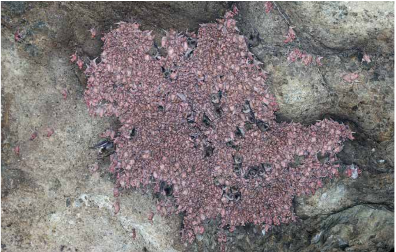
Fig. 1 – Colonia di M. schreibersii all'interno della Sala Quarina della Grotta di Onferno, formata quasi esclusivamente dai giovani nati perché fotografata in orario serale, dopo l'involo degli adulti.

Dall'istituzione della Riserva, i monitoraggi ai pipistrelli sono risultati frequenti e più o meno costanti, anche e soprattutto in ragione dell'abbondante frequentazione turistica cui la grotta è stata sottoposta dagli anni '90, elemento considerato potenzialmente di notevole disturbo ai pipistrelli presenti. Vista l'importante valore chiropterologico del sito, riconosciuto anche a livello nazionale come uno dei più significativi dal punto conservazionistico, dagli anni 2000 è stato anche oggetto di due diversi progetti europei Life, il Progetto Life NAT00IT7216 “ I Chiroteri di Onferno ”, in un periodo di tempo compreso fra il 2002 e il 2007, e il successivo Progetto Life+ 08 NAT/IT/000369 “ Gypsum ”, fra il 2010 e il 2015. Questi due specifici Progetti hanno portato all'acquisizione di numerosi dati sulla chiroterofauna presente nel sito, dati poi aggiornati con regolarità a partire dal 2021, con l'avvio di nuovi monitoraggi periodici dei pipistrelli in grotta.