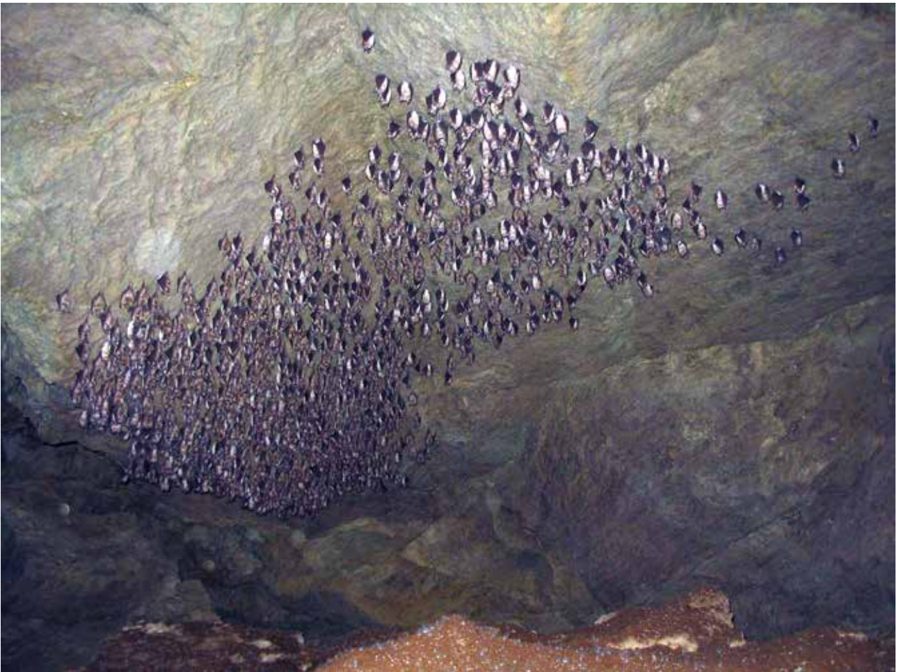
Fig. 10 – Colonia svernante di R. euryale nel complesso carsico Rio Stella-Rio Basino, inverno 2008-2009.