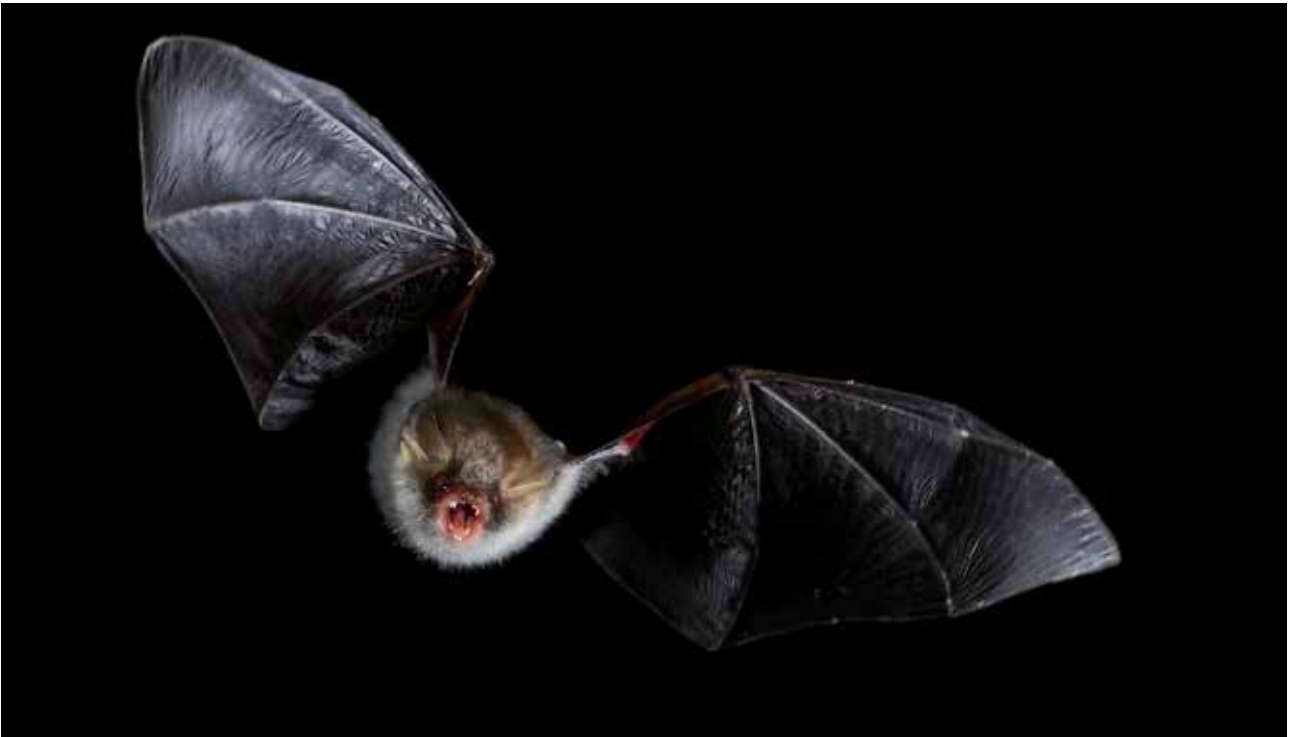
Fig. 9 – Esemplare di vespertilio criptico ( Myotis crypticus ).