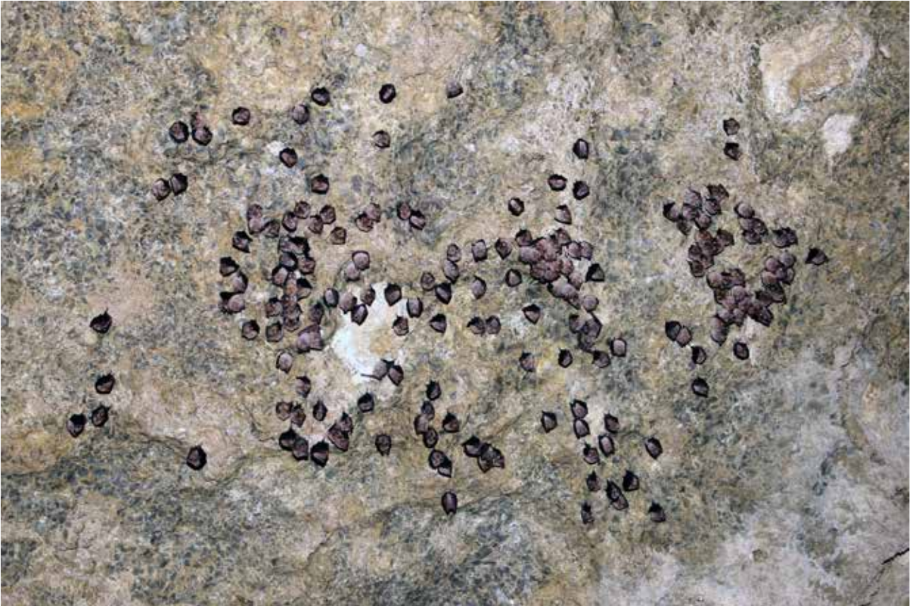
Fig. 7 – Parte della colonia svernante di Rhinolophus ferrumequinum all'interno della grotta Buco del Noce.