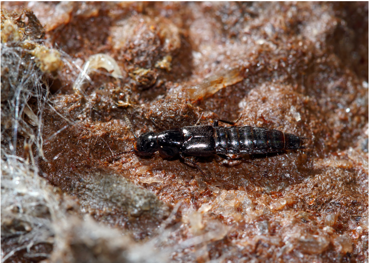
Fig. 13 – Quedius mesomelinus (foto F. Grazioli).

Ca' Boschetti, Grotta II di Ca' Boschetti; FABBRI, POLETTI 2015: 5 La Tanaccia, Abisso Luigi Fantini, Abisso Mornig, Buco del Noce, ex-cava Marana, Grotta Giovanni Leoncavallo, Grotta del Monticino, Grotta risorgente del Rio Cavinale; FABBRI, LUCCI 2016: 6 Grotta del Rio Strazzano, 7 Grotta di Onferno, b Buco sotto la Cascata, Grotta I del Fosso Gambone, Grotta del Bules, Grotta al Sasso della Civetta, Risorgente a sud di Campo Armato, Risorgente di Casa Guidi, c Grotta RSM, Grotta di Pasqua di Montescudo, Inghiottoio del Fosso di Montegiardino - Risorgente di Rio Marano)