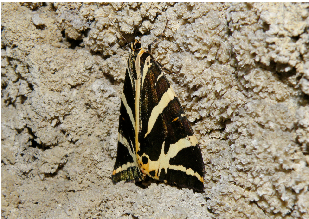
Fig. 15 – Euplagia quadripunctaria.

(ZANGHERI 1966/70: 5 Grotta del Re Tiberio; Fiumi, Cam-