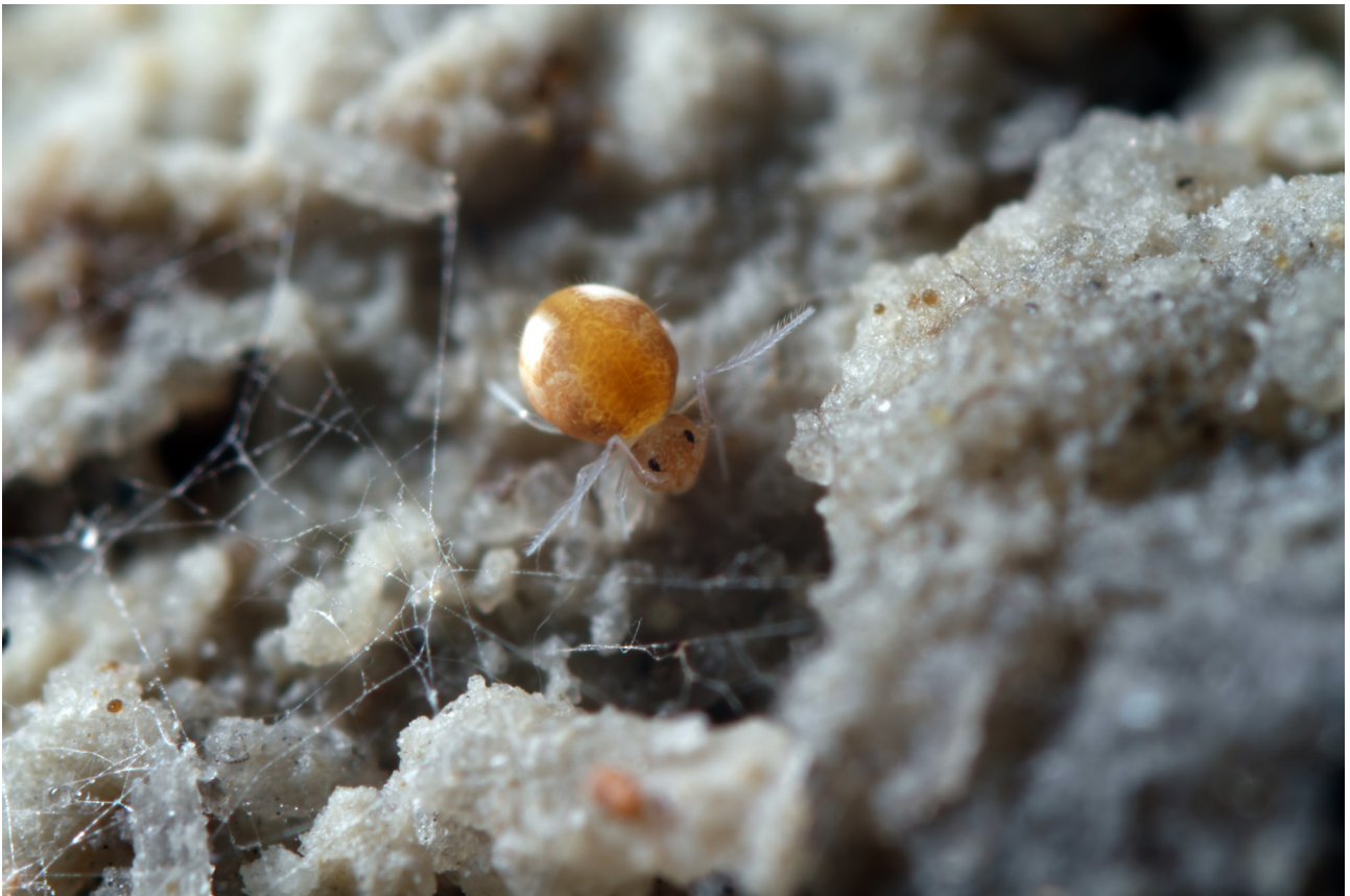
Fig. 10 – Arrhopalites sp..