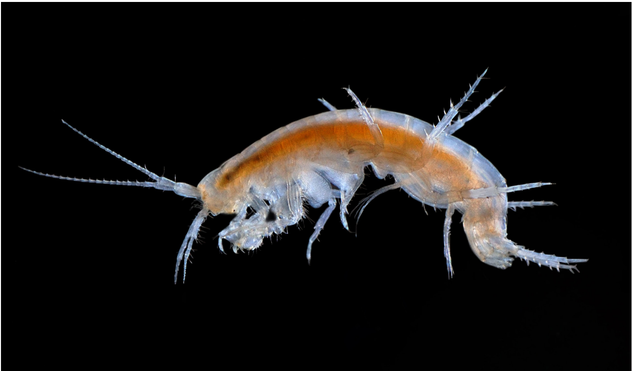
Fig. 8 – Niphargus longicaudatus.

Inghiottitoio del Fosso di Montegiardino - Risorgente di Rio Marano; ONNIS 2024: 5 La Tanaccia, Grotta sotto Ca' Castellina, Grotta risorgente del Rio Basino, Grotta del Re Tiberio, Grotta inghiottitoio a Ovest di Ca' Siepe, Grotta della Befana; RIVALTA 2022: 4 Grotta dell'Anemone Bianca, Grotta della Lepre)