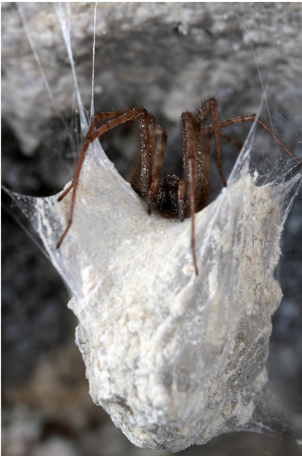
Fig. 4 – Tegenaria parietina.

SANTOLINI 1994: 4 Grotta del Farneto, Grotta della Spipola; RIVALTA 1999: 4; RIVALTA 2012: 4 Buco dei Vinchi; BAMBINI et alii 2015: b Grotte dei gessi di Maiano; FABBRI, POLETTI 2015: 5 La Tanaccia, Abisso Mornig, Grotta risorgente del Rio Cavinale; FABBRI, LUCCI 2016: 6 Grotta del Rio Strazzano, 7 Grotta di Onferno, b Grotta I del Fosso Gambone, Grotta del Bules, Grotta al Sasso della Civetta, Risorgente di Casa Guidi, c Grotta RSM, Grotta di Pasqua di Montescudo; RIVALTA 2022: 4 Grotta Coralupi)