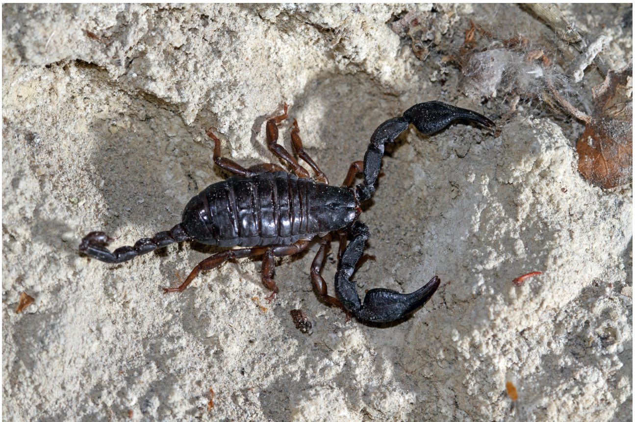
Fig. 2 – Euscorpium italicus.

(BRIGNOLI 1972: 1 Risorgente di Monte Rosso Nesticus speluncarum )