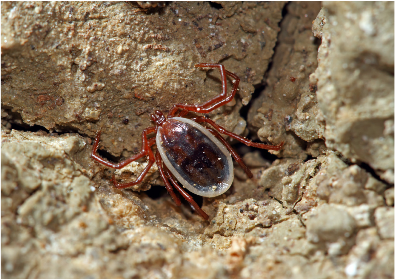
Fig. 5 – Ixodes vespertilionis.