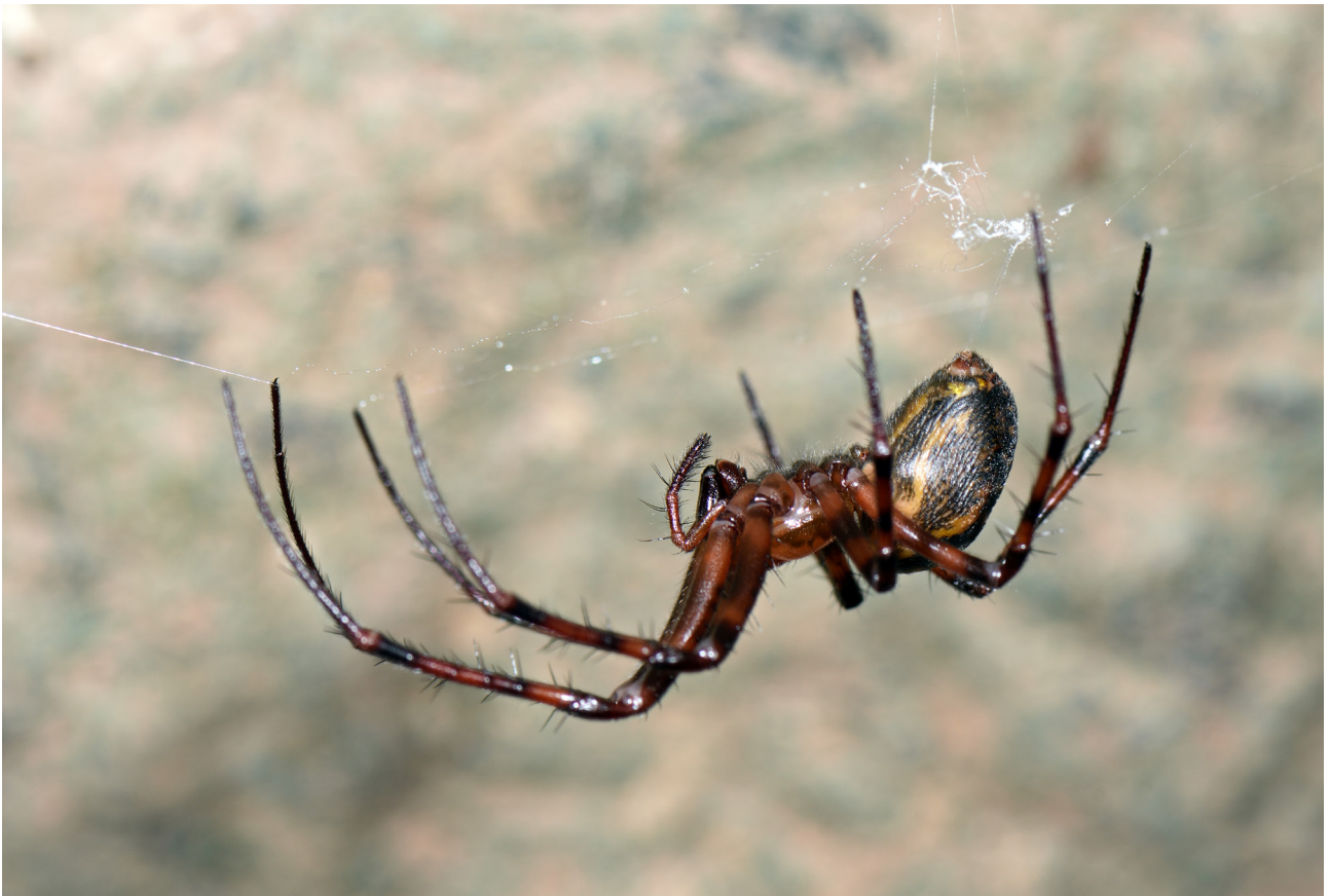
Fig. 3 – Meta menardi.

Kryptonesticus eremita (Simon, 1880) – 1, 3, 4, 5, 6, 7, a, b, c Specie eutroglofila.