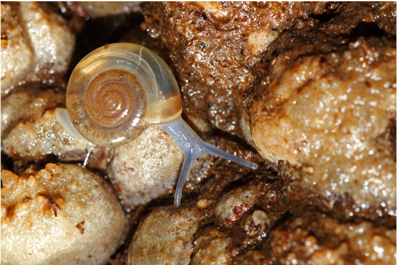
Fig. 1 – Oxychilus cfr. meridionalis.

Grotta della Spipola, Grotta Gortani Oxychilus villae )