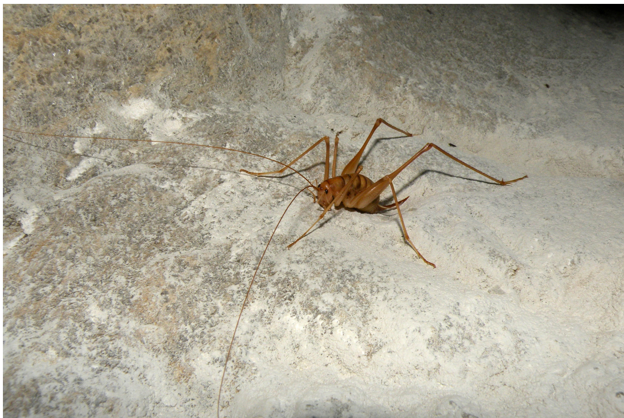
Fig. 12 – Dolichopoda laetitiae.

Anillus florentinus (Dieck, 1869) - 5 Specie subtroglifila. (CONTARINI 1994: 5; CONTARINI, 2010: 5; CONTARINI, 2010-1: 5 Grotta risorgente del Rio Basino) Duvalius (Duvalius) guareschii (Moscardini, 1950) - 1 Specie anoftalma endemica dell'Alto Appennino Emiliano; specie protetta dalla L.R. n. 6/2005. (REGIONE 2018: 1 Grotta della Gacciolina) Laemostenus (Actenipus) latialis (Leoni, 1907) - 6, 7, b, c Specie eutroglifila, endemica dell'Appennino centrale. (FABBRI, LUCCI 2016: 6 Grotta del Rio Strazzano, 7 Grotta di Onferno, b Grotta al Sasso della Civetta, c Grotta RSM) Pterostichus sp. - 5 Specie subtroglifila. (ONNIS 2024: 5 La Tanaccia) Pterostichus micans (Heer, 1841) - 5 Specie subtroglifila. (ONNIS 2024: 5 Grotta risorgente del Rio Basino, Grotta del Re Tiberio, Grotta inghiottitoio a Ovest di Ca' Siepe) Scotodipnus (Scotodipnus) glaber (Baudi di Selve, 1859) - 5 Specie subtroglifila. (BASSI 1999: 5 Grotte di Rontana e Castelnuovo; CONTARINI 1994: 5; CONTARINI, 2010: 5; CONTARINI, 2010-1: 5 Grotta risorgente del Rio Basino) Trechus binotatus (Putzeys, 1870) - 5 Specie subtroglifila. (ONNIS 2024: 5 Grotta sotto Ca' Castellina)