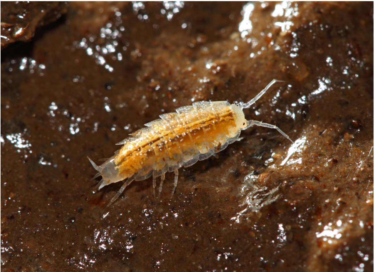
Fig. 7 – Androniscus dentiger.