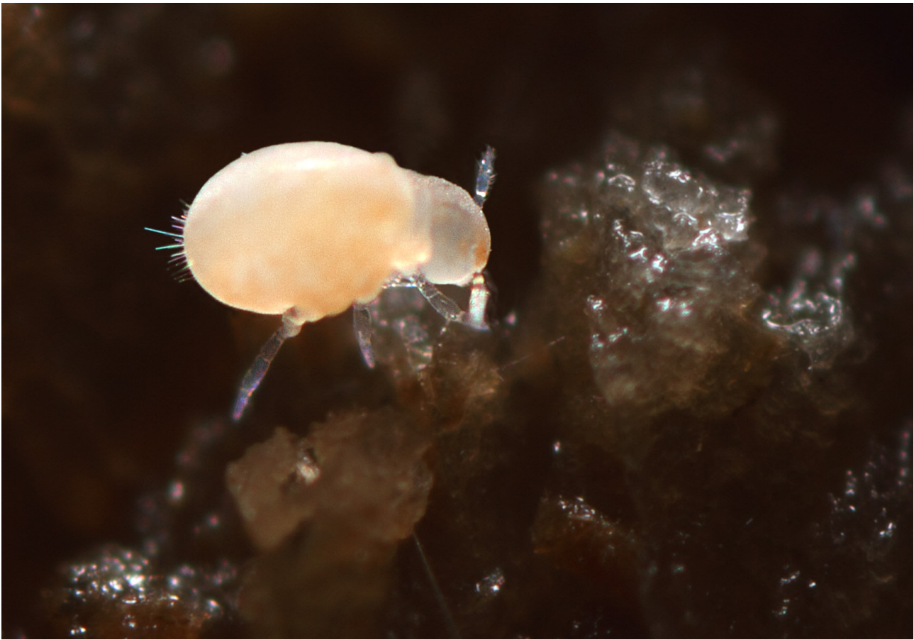
Fig. 11 – Neelus murinus.

Specie eutroglofila endemica dell'Appennino centro-settentrionale, dall'Emilia al Lazio. Specie protetta ai sensi della L.R. n. 15/2006