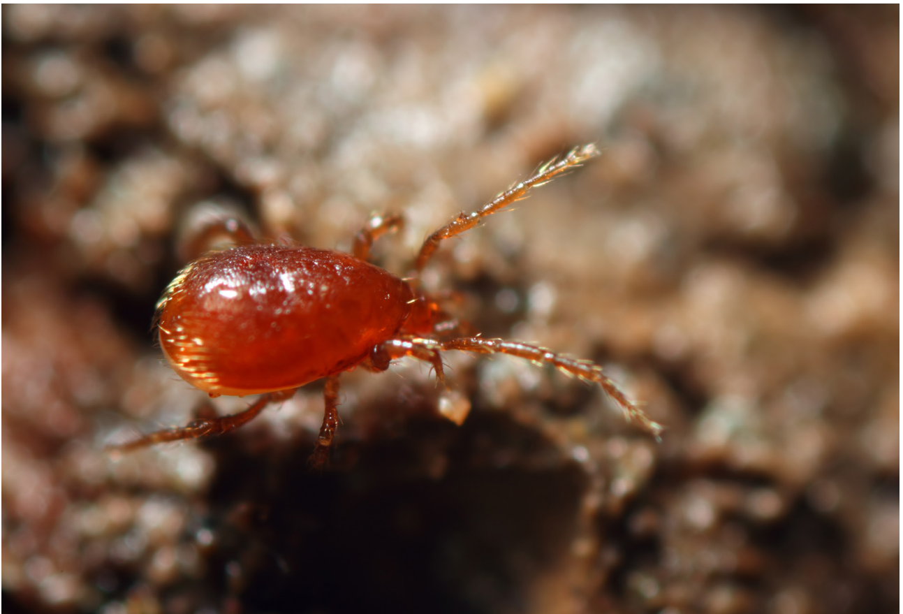
Fig. 6 – Parasitidae sp. n.d. (foto F. Grazioli).