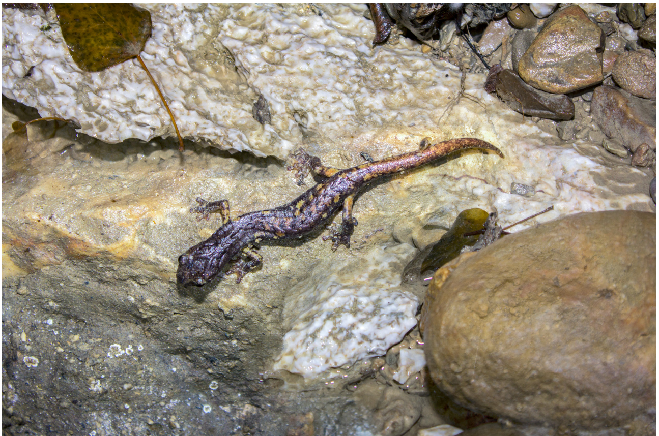
Fig. 16 – Speleomantes italicus.

(MAZZOTTI, STAGNI 1993: 1, 5 Abisso Luigi Fantini; MAZZOTTI et alii , 1999: 1, 5 Abisso Luigi Fantini; COSTA, 2010: 5 gessi di Brisighella; GIGANTE 2015: 1; PENAZZI, PIRAZZINI 2015: 5 Abisso Luigi Fantini; COSTA, PENAZZI 2016: 6 Grotta del Rio Strazzano, Buco del Pendolo di Rio Strazzano)