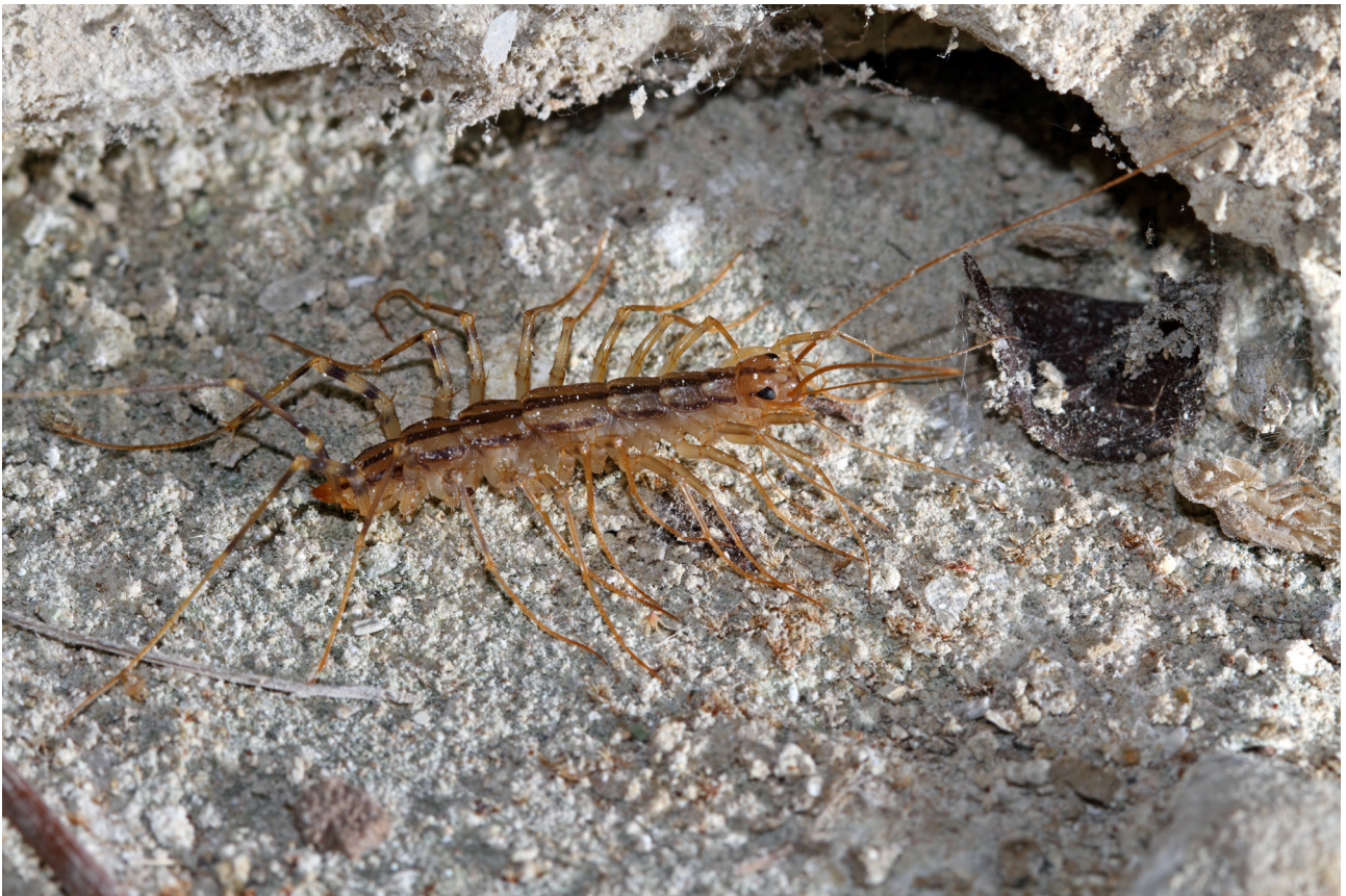
Fig. 9 – Scutigera coleoptrata.