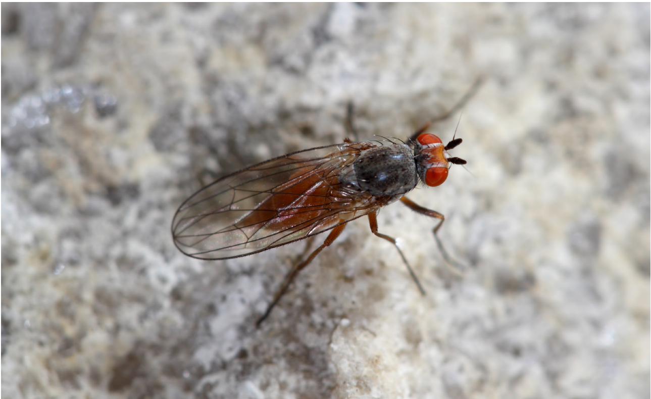
Fig. 14 – Heteromyza atricornis.